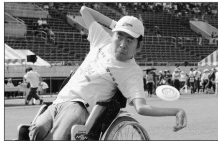
後ろ向きになって...